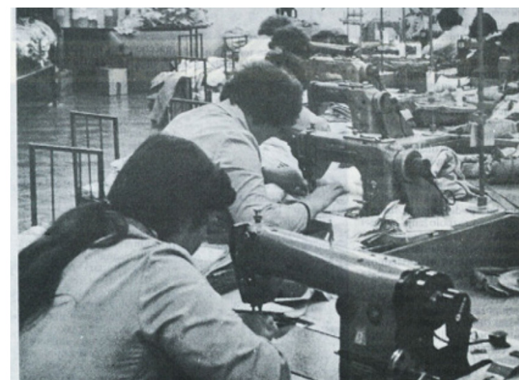
LABOD LIBNA 1990