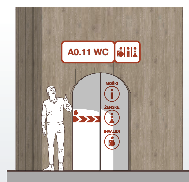
OZNAKE ZA BOLJŠO DOSTOPNOST