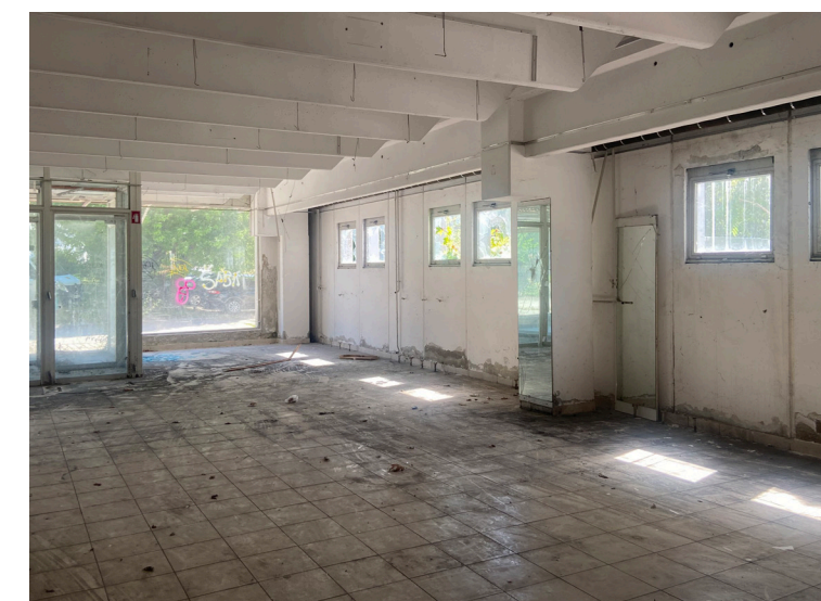
LABOD LIBNA 2025