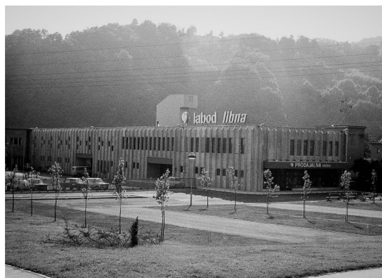
LABOD LIBNA 1980

Poleg splošnih potreb po prostoru za druženje, kulturnih in izobraževalnih dejavnosti je vse bolj prepoznana potreba po vključujočem prostoru, ki upošteva posebne potrebe, kot so značilne za osebe z avtizmom. Tak prostor je jasno strukturiran, umirjen, vizualno prijeten in zmanjšuje senzorno preobremenitev, hkrati pa omogoča socialno interakcijo in občutek pripadnosti. Analiza širšega konteksta je pokazala raznoliko demografsko strukturo prebivalcev in opozorila na primanjkljaj družabnih ter kulturnih vsebin, ki bi nagovarjale različne generacije, posebej v večernem času, ko območje hitro izgubi živahnost.