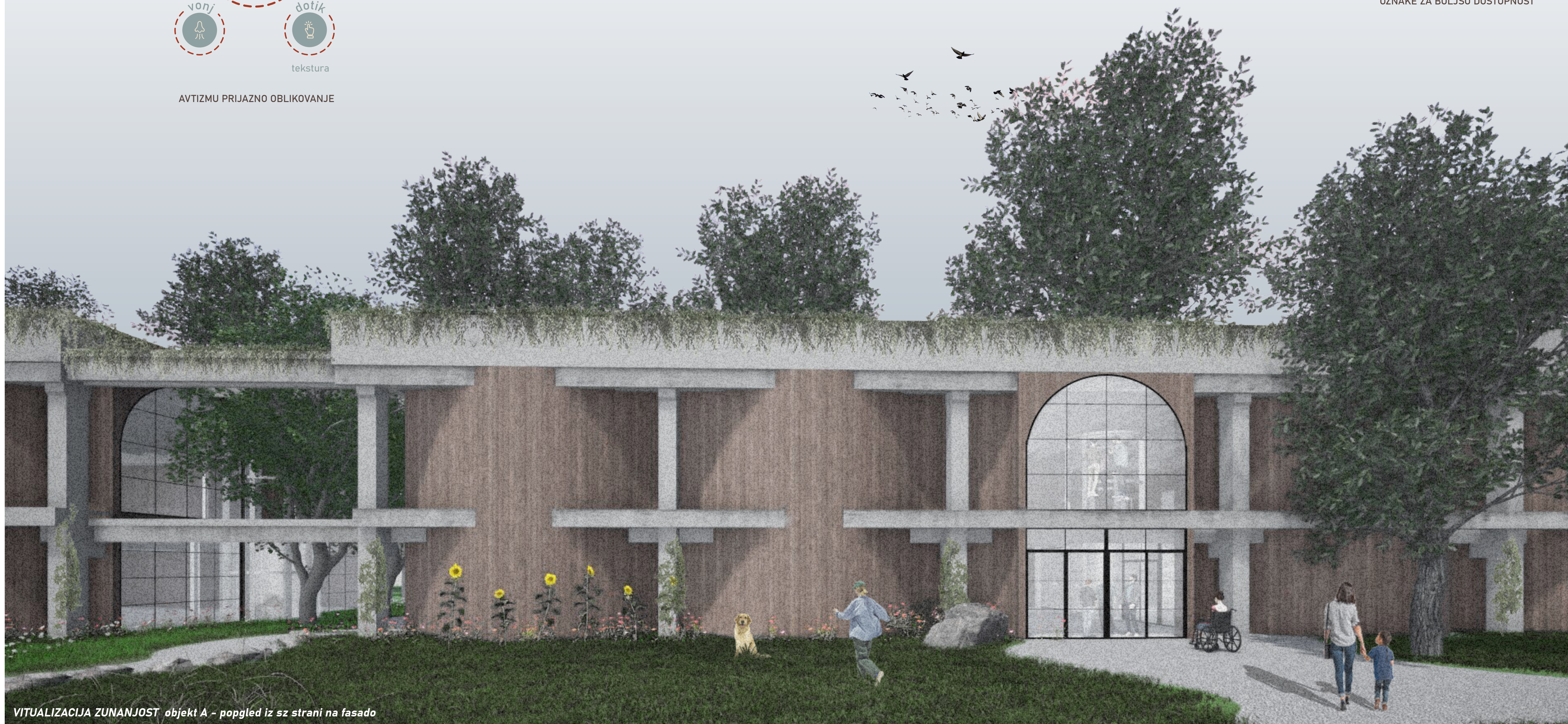
VIRTUALIZACIJA ZUNANJOST objekta A - pogled iz strani na fasado