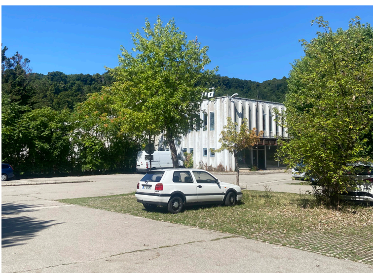
LABOD LIBNA 2025