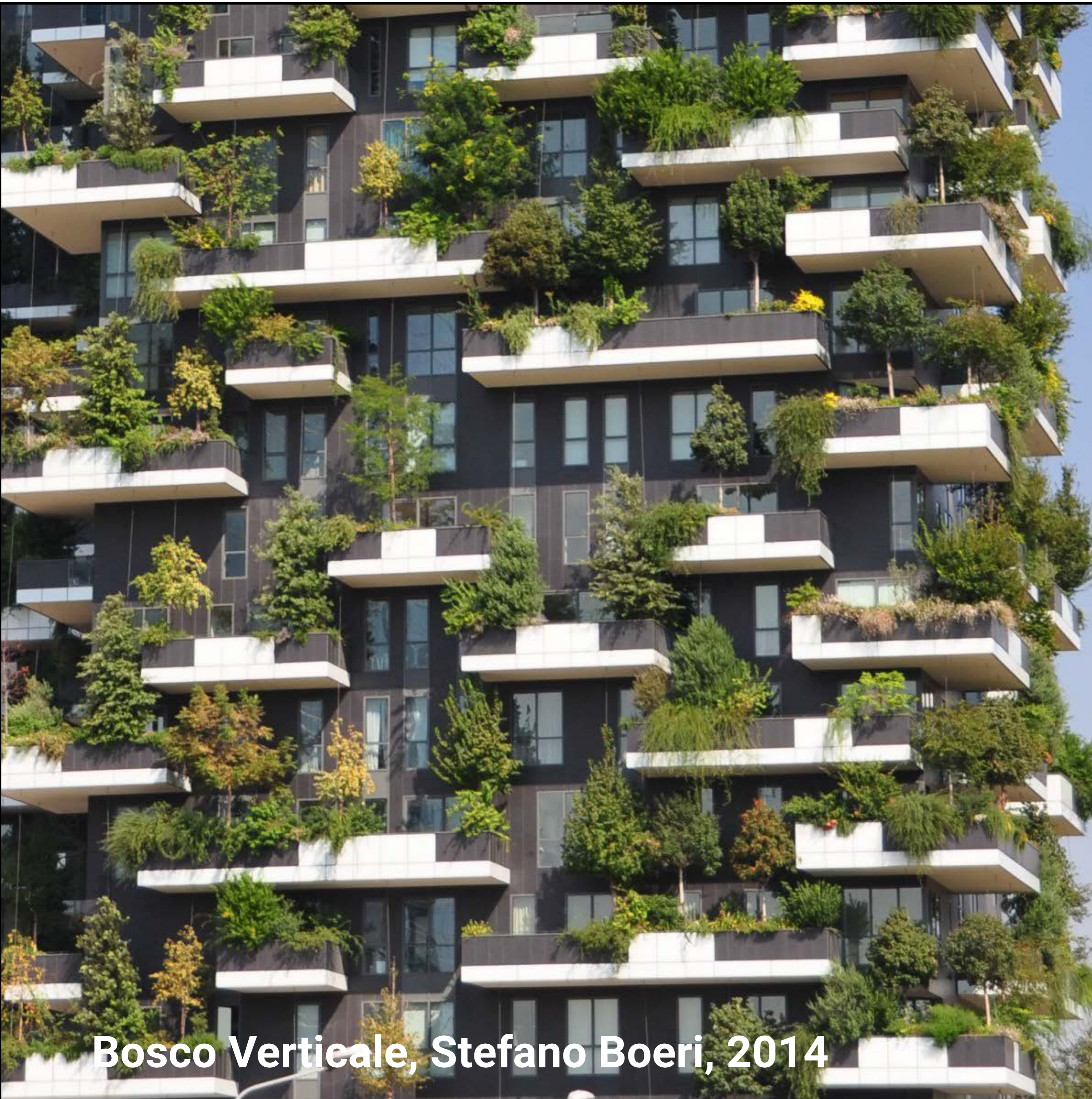
Bosco Verticale, Stefano Boeri, 2014