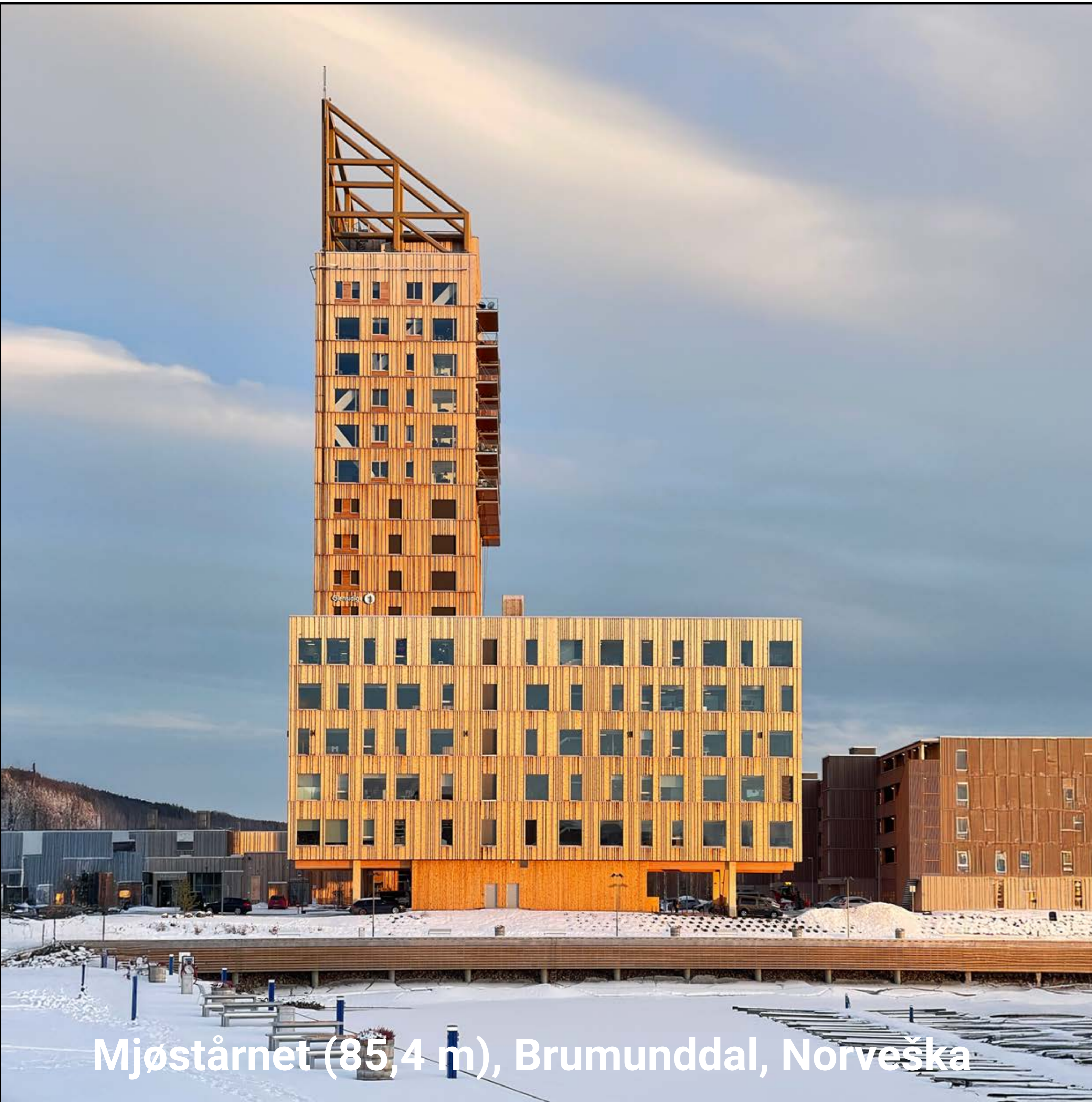
Mjøstårnet (85,4 m), Brumunddal, Norveška