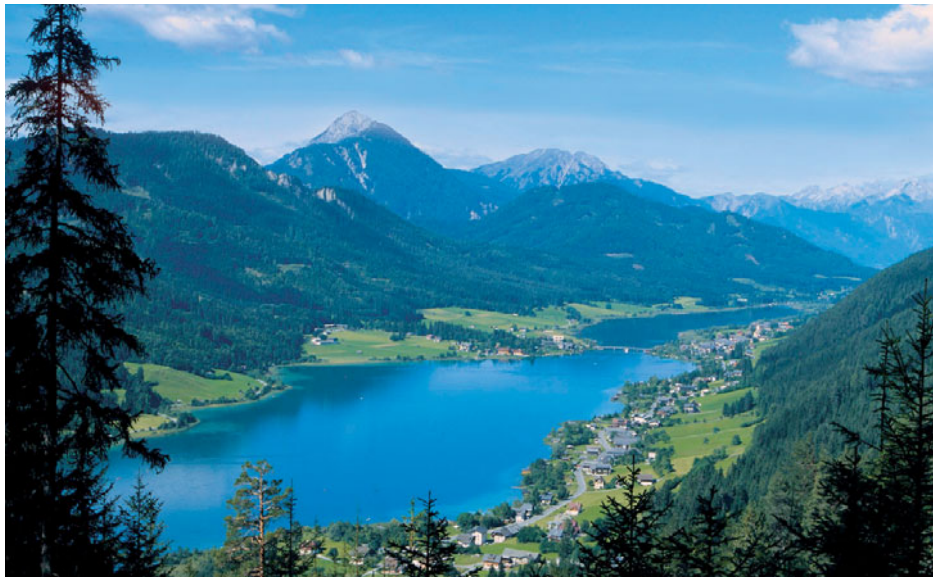
Lokacija simpozija »tri Alpe Adria« na čudovitem Belem jezeru: čas za nova znanja, izmenjavo izkušenj in navezovanje pomembnih novih stikov.

• najboljše trenutne rešitve na področju energetske zelo učinkovite gradnje, ki jih bodo predstavili poznavalci iz Avstrije, Nemčije, Italije in Slovenije; • odlične objekte na kraju samem v okviru poldnevne ekskurzije z obiskom vzorčnih stavb na avstrijskem Koroškem; • vrhunske storitve in trende ter zasnove in primere dobrih standardnih rešitev; • možnosti, pasti in podrobne rešitve; • najboljše strategije za gospodarne rešitve.