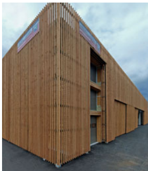
Energetsko učinkovita arhitektura na terenu! Vsi udeleženci simpozija se odpravijo na izlet: na sliki je proizvodni obrat, ki izdeluje elemente za pasivne hiše.