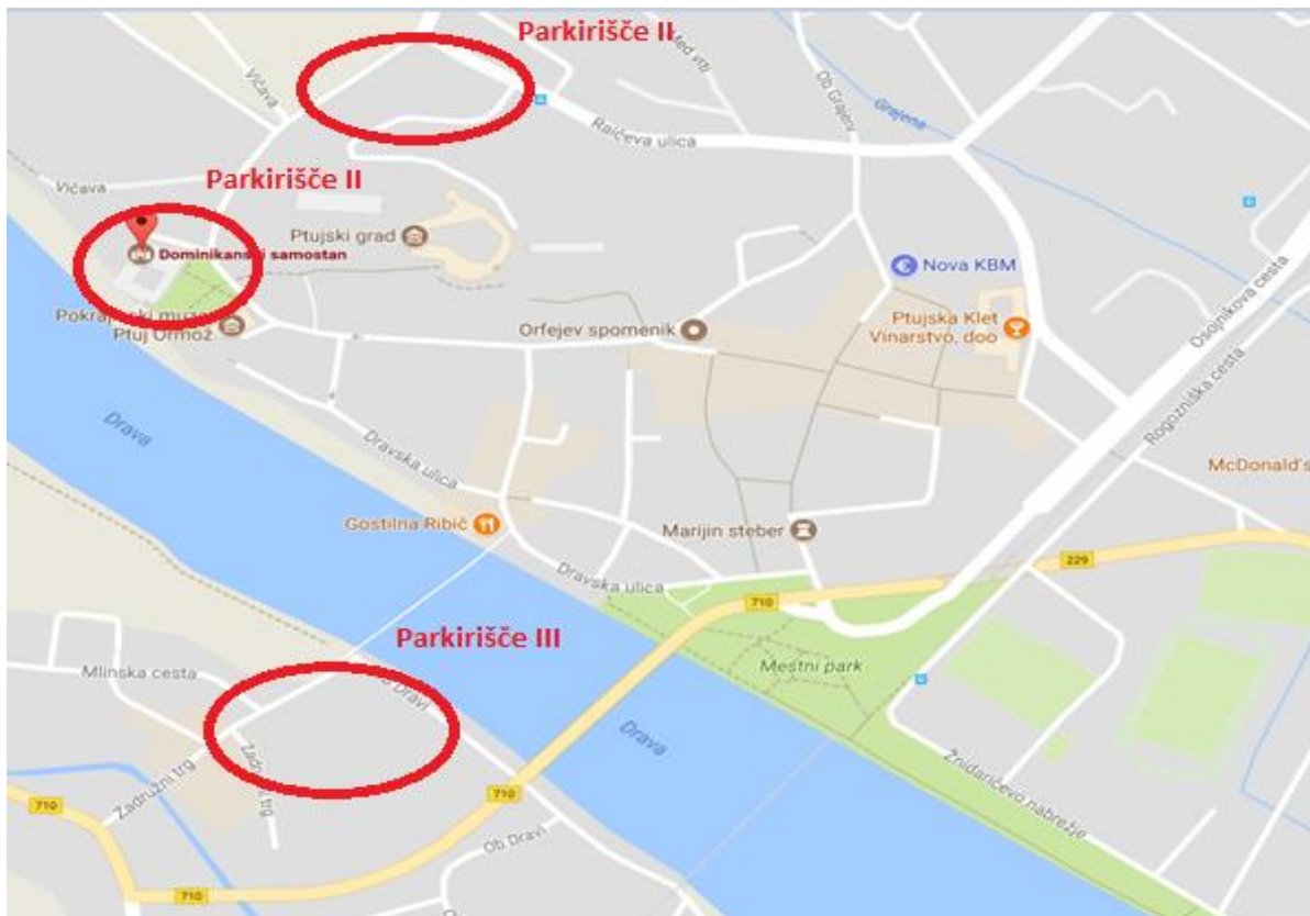
Slika 7: Možnost parkiranja

V izogiba prometnemu zastoju, na Puhovem mostu, je možno parkiranje na urejenem parkirišču Zadružni trg 15 (Parkirišče III). Z to opcijo vam je podana možnost, da si kot pešec, ogledate del starega mestnega jedra Ptujja vse do Dominikanskega samostana. Reko Dravo prečkate preko Ptujске brvi.