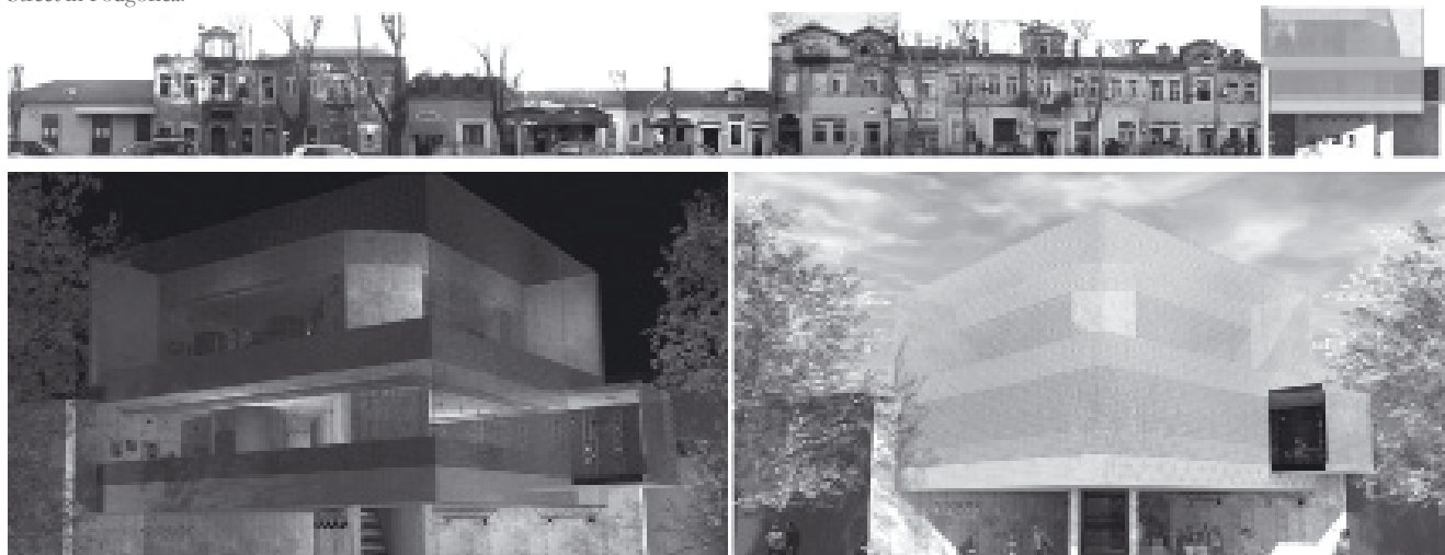
Figure 7: Architecture as a dialectic provocation; diametrical contrast between historical structured street and the new façade uses flat membrane, lights and clear cubic forms. This missing link ties past and future. The skin of the new building introduces new dialogue in the architecture of the street, E. Mihailović, Bussines Centre in Bokeška Street in Podgorica.

Slika 7: Dijalektička provokacija – izraziti kontrast nove membrane i svijetleće forme sa kubičnim strukturama. Funkcioniše kao spona između prošlosti i budućnosti.. "Koža" objekta predstavlja i njegov nervni centar sa svjetlosnim efektima koje pokazuju jedinstvene arhitektonske karakteristike / Ena Mihailović – Poslovni incubator u Bokeškoj ulici.