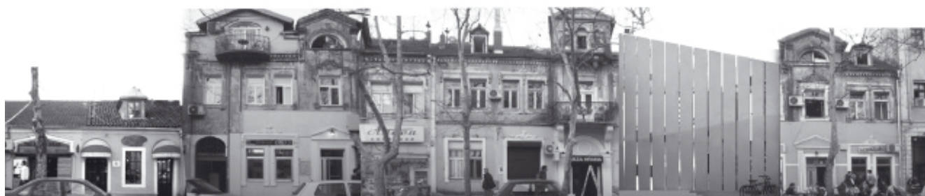
Figure 8: Ignoring as suspension method promote computer generated architecture language with detached relationship with surrounding buildings, N. Mijušković, Residential unit in Bokeška Street in Podgorica.

Slika 8: Potpuno ignorisanje istorijskog urbanog konteksta. Dizajn je prkosno utisnut sa svojim prepoznatljivim stilom, kompjuterski generisan ... dopunjen u kontrastu sa susjednim objektima jer radikalno "lomi" klasičnu simetriju na koju "naslanja" svoju estetiku / Nevena Mijušković - stambena jedinica u Bokeškoj ulici.