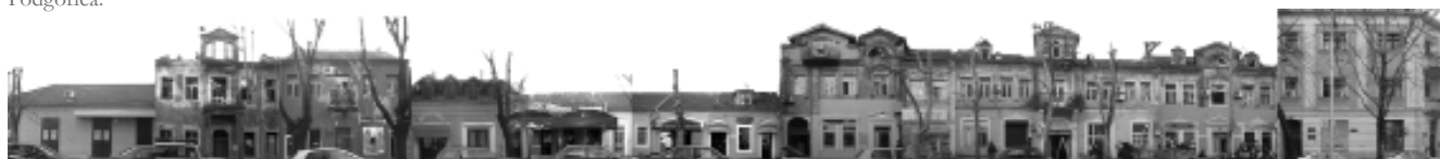
Figure 3: Houses in the Bokeška Street in Podgorica.