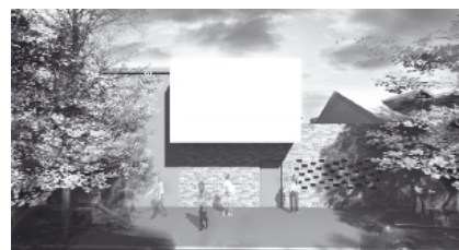
Slika 6: Metodom isticanja teži se uspostavljanju ravnopravnog odnos postojećeg i novoprojektovanog objekta / Marija Čaćić – stambeni objekat u Bokeškoj ulici. Figure 6: Methods of contrast used as balancing element between new and existing architecture, M. Čaćić, Bokeška Street in Podgorica.

Complementary contrast – is assigned to overpower the expression of the existing structures, by creating the feeling of "tension" among volumes. The contrast is treated as aspiration for the opposite, non-harmonious. As this as the most delicate method which is frequently on the edge of decreasing the value of the context, affirming entirely new creative ideas which are frequently the demonstration of power and technological achievements, it was not frequently applied and it did not provide results which can be regarded as successful. It is favourite method of the so-called "star" architects. Dialectical provocation – represents a highly innovated concept, which "provokes" on several levels – from visual, functional, programme which is able to retain provocation blade, social critique during the long period of time, etc. It moves the limits of our perception, feelings and contemplations related to the space, so it may be turned into permanent values.