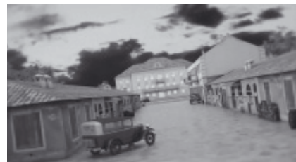
Slika 3: Prikaz uničnog niza Bokeške ulice u Podgorici.

Figure 3: Houses in the Bokeška Street in Podgorica.