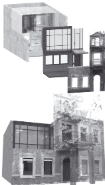
Slika 5: Metodom ignorisanja postojećeg novim teži se uspostavljanja ravnopravnijeg odnosa kada arhitekta smatra da je potrebno naglasiti neki element / Andrea Pajković – poslovni inkubator u Bokeškoj ulici.