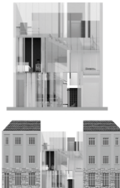
Figure 5: Methods of complementary contrast in design within the context historical urban pattern, A. Pajković, Bussines Centre in Bokeška Street in Podgorica.