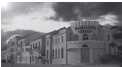
Figure 2: Nova Varoš (Mirkova) in the past.