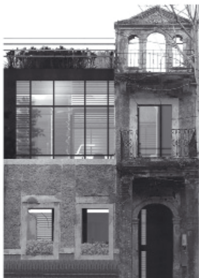
Figure 4: The role of contemporary interpolations in historical context, A. Novičević, residential unit in Bokeška Street in Podgorica.