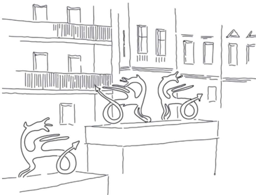
Slika 1: Skica zmajev na obrežni ograji ob Zlati ladjici v Ljubljani. Skica: Stefani Berginc. Figure 1: Sketch of a dragon at the promenade, along the Ljubljana, Breg

Zmajevo pot smo povzeli v ustvarjalni beležki. Koncept te je platenje. Na vsaki strani so z luknjico označene lokacije posameznih zmaje, ki se po plasteh odkrivajo in oblikujejo Zmajevo pot. Začne se z eno lokacijo, nato se na vsaki strani dodaja po dve novi. Uporabnik si tako sam izbere, katero lokacijo in zmaja bo obiskal in na ta način ustvari svojo pot. Izkušnja posameznika je zato edinstvena. Na zadnji strani so zbrane vse lokacije z namenom, da si vsak sešije prehojeno pot, tako da napelje priloženo vrvico skozi obstoječe luknjice. Kdor želi, lahko sešito stran izreže in jo pošlje kot razglednico.