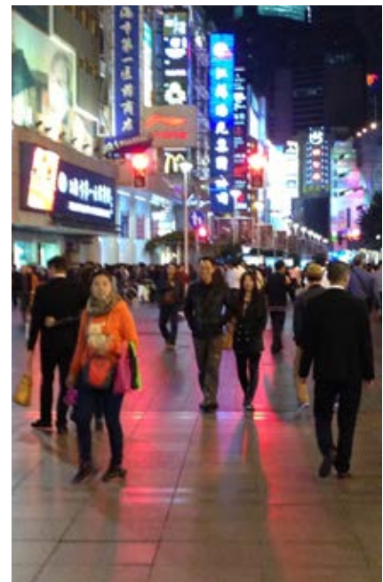
Figure 8: Street Nanjing – a modern Chinese public space in the domain of consumption and entertainment.

Slika 8: Ulica Nanjing – sodobni kitajski javni prostor v domeni potrošnje in zabave.