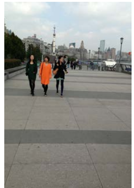
Figure 6: The Bund Promenade at Huangpu River in Shanghai.