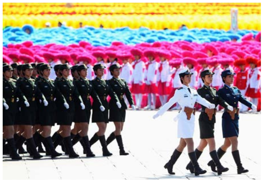
Slika 2: Parada na Trgu nebeškega miru ob 60. obletnici ustanovitve Ljudske republike Kitajske. Vir: Feng Li/Getty Images. ( www.boston.com/bigpicture/2009/10/china_celebrates_60_years.html )

Figure 1: Shanghai once cosmopolitan city, today one of the most important economic, financial and communications centers. Source: Špela Hudnik.