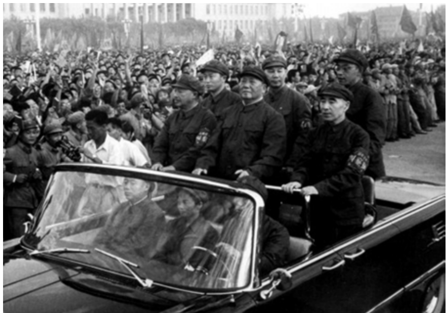
Figure 3: Mao Zedong and Lin Biao on parade at Tiananmen Square during the period of the Cultural Revolution. Source: Xinhua. ( www.scmp.com/news/china/policies-politics/article/1854968/flying-red-flag-chinas-hongqi-wheeled-out-president )

Slika 3: Mao Zedong in Lin Biao na sprevedu na Trgu nebeškega miru v obdobju kulturne revolucije. Vir: Xinhua. ( www.scmp.com/news/china/policies-politics/article/1854968/flying-red-flag-chinas-hongqi-wheeled-out-president )