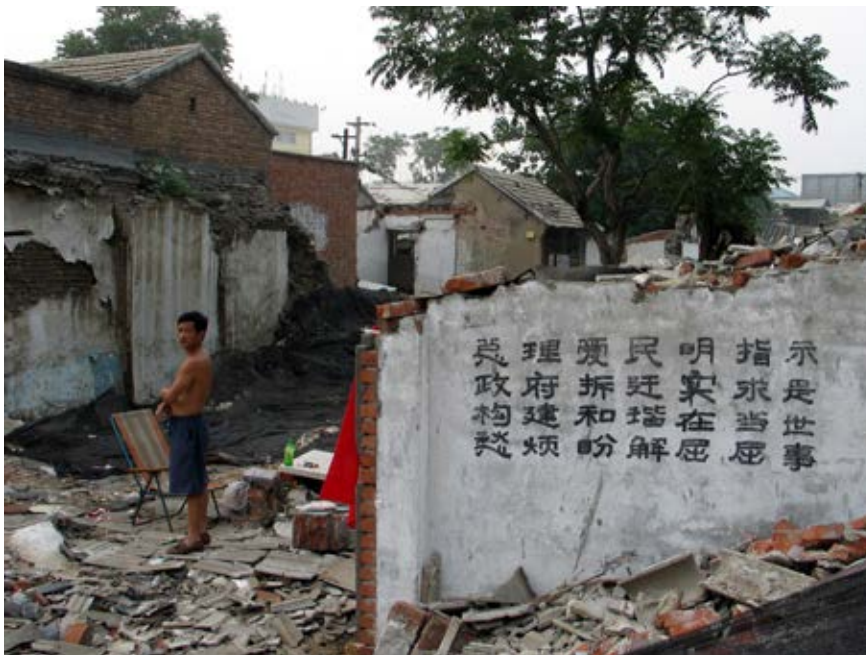
Figure 7: Meishi streets, a symbol of the fight against Chinese policy large urban plans. The demolition of the neighborhood and the traditional patterns of communal life in the hutongs for the upcoming Olympic games (from the film Meishi Street, Ou Ning).

Slika 8: Ulica Nanjing – sodobni kitajski javni prostor v domeni potrošnje in zabave.