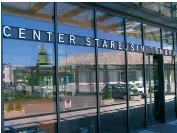
Slika 2: Zaradi staranja prebivalstva se razvite družbe soočajo s problemom premajhnih kapacitet v institucionalnih ustanovah za oskrbo starejših.

sistem. Do leta 2060 se bo namreč razmerje med številom delavcev (od 15 do 64 let) in številom upokojencev (starejših 65 let) zmanjšalo z okoli 5:1, kolikor je znašalo še leta 2000, na 1,9:1, v Sloveniji celo na 1,7:1 [Eurostat, 2011]. V primeru nespremenjene stopnje zajetja upravičencev do kontingenta starega prebivalstva, nespremenjene ravni pravic v razmerju do produktivnosti in nespremenjene stopnje zaposlenosti, je torej povečanje deleža javnih izdatkov v zvezi s staranjem v BDP enaka rasti koeficienta odvisnosti starega prebivalstva [Dimovski in Žnidaršič, 2007].