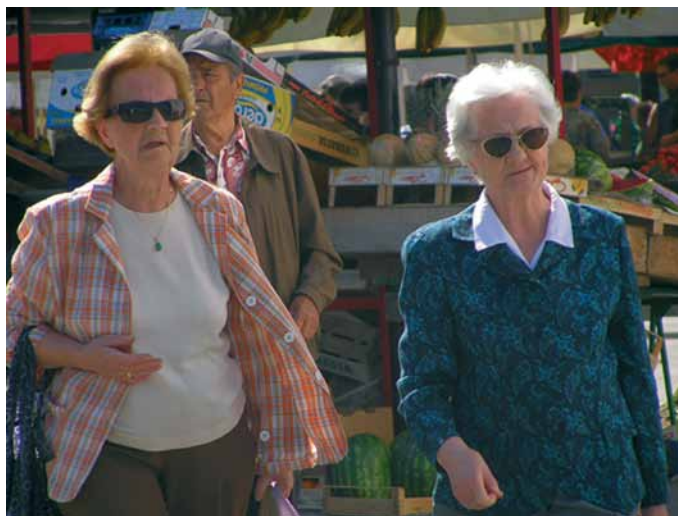
Slika 1: Delež starejših se v družbi hitro povečuje.

Zaradi staranja prebivalstva, zlasti zaradi hitrega povečanja števila starih in slabotnih ljudi, ki praviloma potrebujejo zelo veliko oskrbe in nege, vse bolj narašča povpraševanje po zdravstvenih in socialnih storitvah in ustvarja vse večje stroškovne pritiske na obstoječi zdravstveni in socialni sistem. Čeprav je finančna vzdržnost teh storitev že zdaj skrb vzbujajoča, se bodo po napovedih Komisije Evropskih skupnosti [2007] v prihodnje izdatki že za pokojnine, zdravstveno varstvo in dolgotrajno oskrbo povečevali za 4–8 % BDP, skupni stroški zdravstvenih in socialnih storitev pa naj bi se do leta 2050 potrojili. Samo za socialno varstvo, na primer, naj bi v državah članicah Evropske unije leta 2050 delež stroškov znašal okoli 35 % BDP [Jespén in Leschke, 2008].