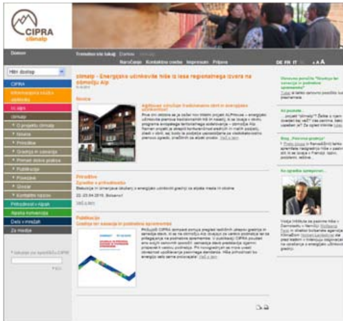
Slika 4: Shematski primer pregledne spletne strani cipra.org.