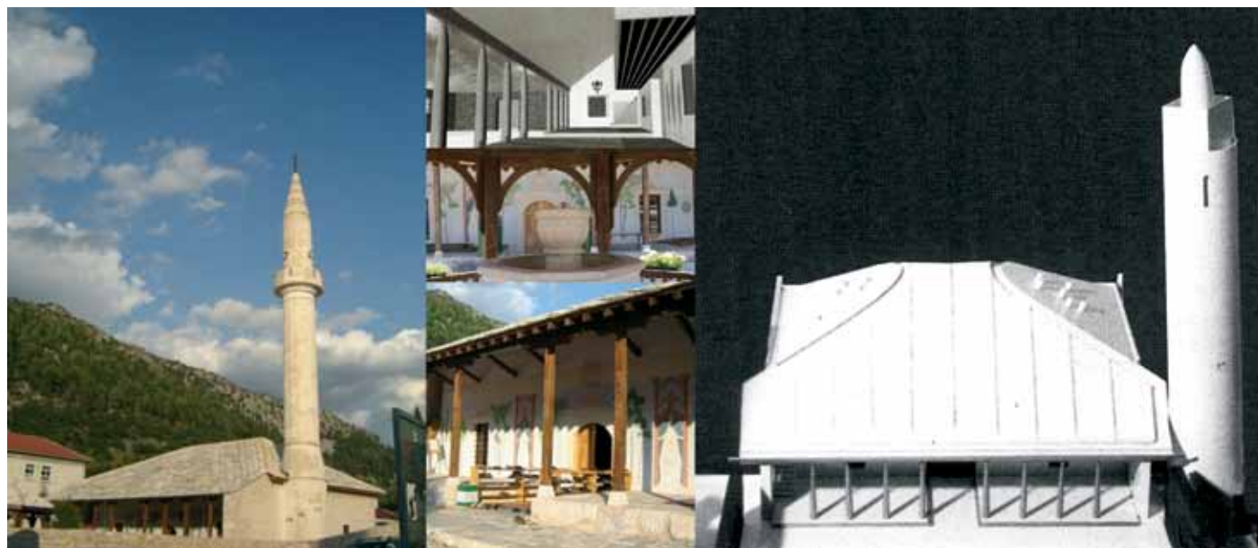
Slika 4: Rekonstrukcija Careve mošeje in primerjava s projektom Z. Ugljena.

Takoj se poraja vprašanje, zakaj se je investitor odločil za tako ekstremno in dokaj iracionalno potezo, kot je nova gradnja (vsi objekti so bili porušeni do tal), s podobo in metodami stare. Odgovor nam delno nudi K. Lynch (1998), ki trdi, da je učinkovita podoba produkt čutnih izkušenj in spominov, ki