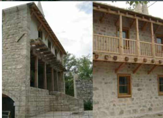
Slika 6: Mošeja Podgrad pred vojno, povojna rekonstrukcija mošeje in spremljajočega objekta (na nasprotni strani ulice) (vir slikovnega gradiva: Hasandedić 16, arhiv avtorice).