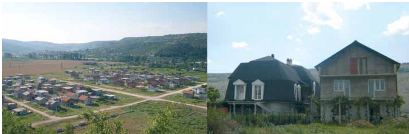
Slika 2: Gradnja novih naselij.