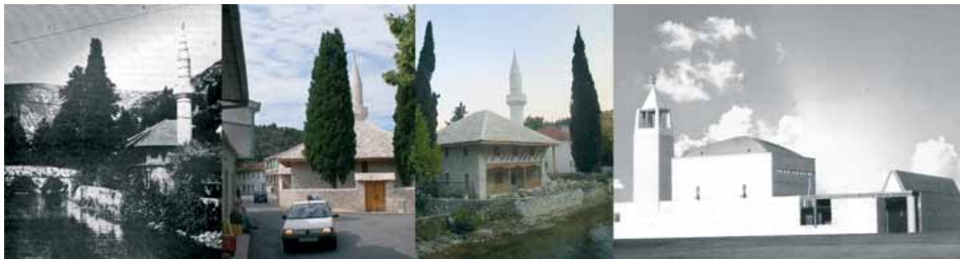
Slika 5: Hadži Alije Hadžihasanovića mošeja pred vojno, povojna rekonstrukcija (sprednja in zadnja stran) in predlog Z. Ugljena (pogled z ulice).

Zato je tudi zanimiva misel Ignatieffa, ki z uporabo Freudovega izraza "narcisizem manjše razlike" trdi, da ko se zunanje razlike med skupinami zmanjšujejo, postajajo simbolne razlike bolj pereče, bolj pomembne, da postanejo "maska razlikovanja" (1999). Zlasti v konfliktnih časih kulturni simboli pogosto zavzamejo značilne ikonske lastnosti, ki opredelijo in ustvarijo občutek razlike. Nasprotno, ko je ustanovljena razlika, "istost" lahko zagotovi vir legitimnosti (de Condappa 2008). Zlitje pojmov kulture in pravice predvideva močno mobilizirajočo dialektiko, ki lahko izmenično privilegira ali zanika pojmovanja legitimnosti. "Pooblastilo" za izbris kulture zato bistveno vpliva na legitimnost skupine in v skrajnih primerih na njeno pravico